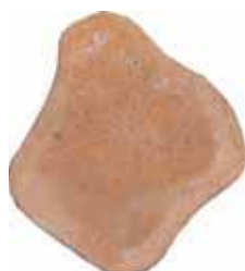
piastra per percorso giapponese