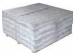
piastre lisce per camminamenti da spiaggia