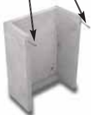
Bocca di lupo in cemento