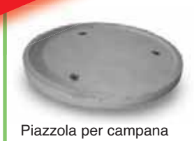
Piazzola per campana