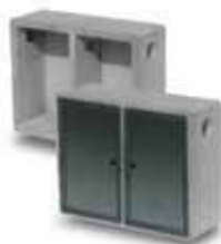
Cassetta gas HOME doppia