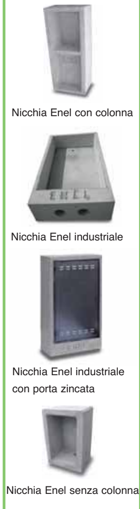
Nicchia Enel con colonna