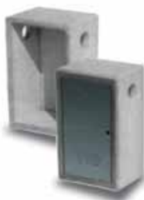
Cassetta gas HOME singola

in cls gettato per abitazioni con porta zincata/inox non compresa nel prezzo