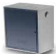
Cassetta gas FARM singola