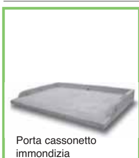
Porta cassonetto immondizia