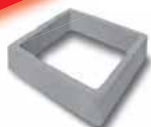
Prolunga norm. h.15