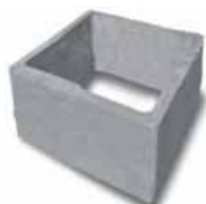
Prolunga norm. h.40/50