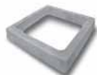
Prolunga rinf. h.15