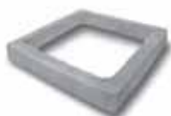
Prolunga rinf. h.10