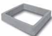
Prolunga norm. h.10