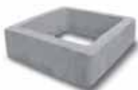
Prolunga rinf. h.25