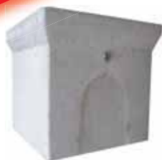
Prolunga c/giunto bicchiere Prezzo Pozzetto/Prolunghe 200x200 a pag.124