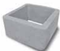
Prolunga rinf. h.40