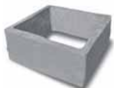
Prolunga norm. h.20/25