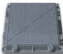
Chius.Serie Telefunia P2