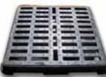
Cad. piana sifonabile