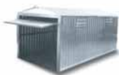
Box con porta basculante