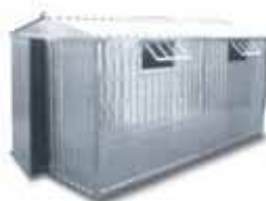
Box con porta a 2 ante

in lamiera zincata, per auto e cantieri con porta a 2 ante