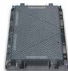
Chius.Serie Telefunia P4