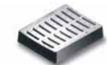
Cad. serie cunetta